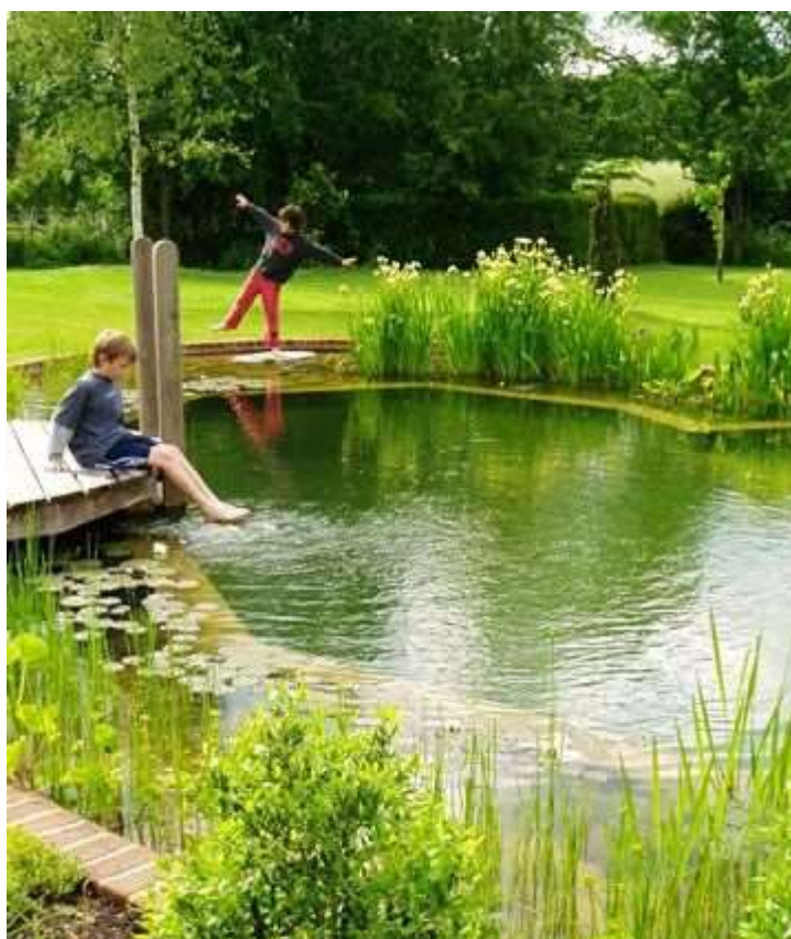
Illustrazione 2 Biotopo (Esercizio 3)