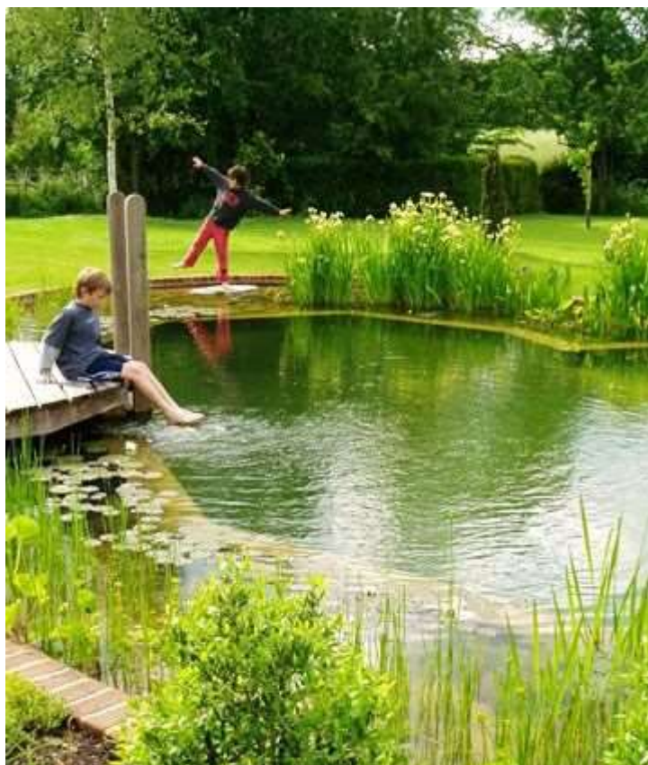
Illustration 2 Biotope (exercice 3)